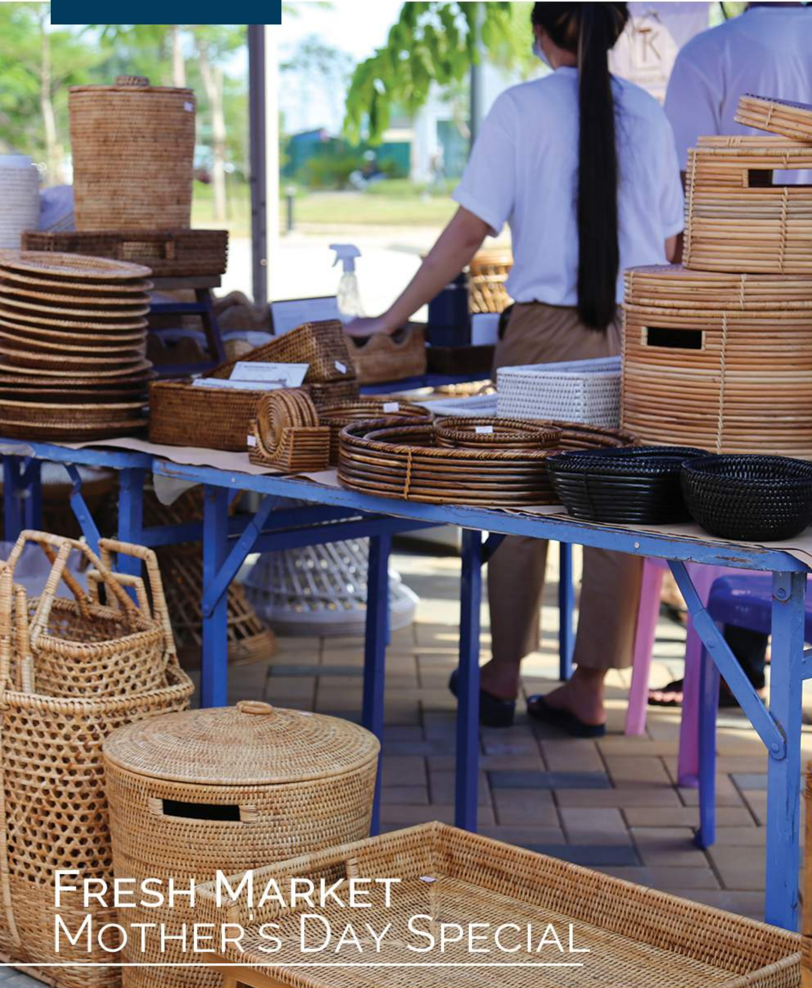
FRESH MARKET MOTHER'S DAY SPECIAL